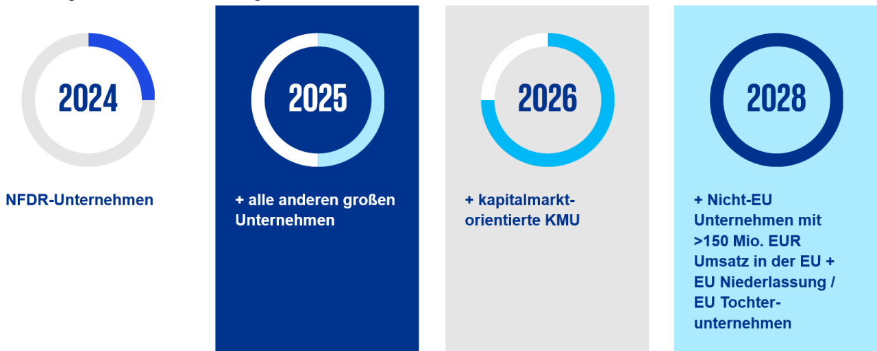
Abbildung 1 - CSRD-Anwendungsbereich